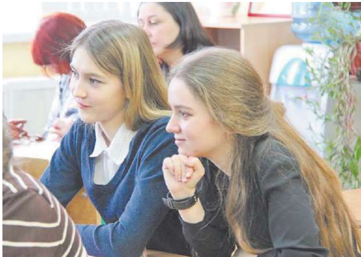
ЕГЭ уже через 3 месяца!

Рекламная поддержка вашего бизнеса 8(498) 681-51-16