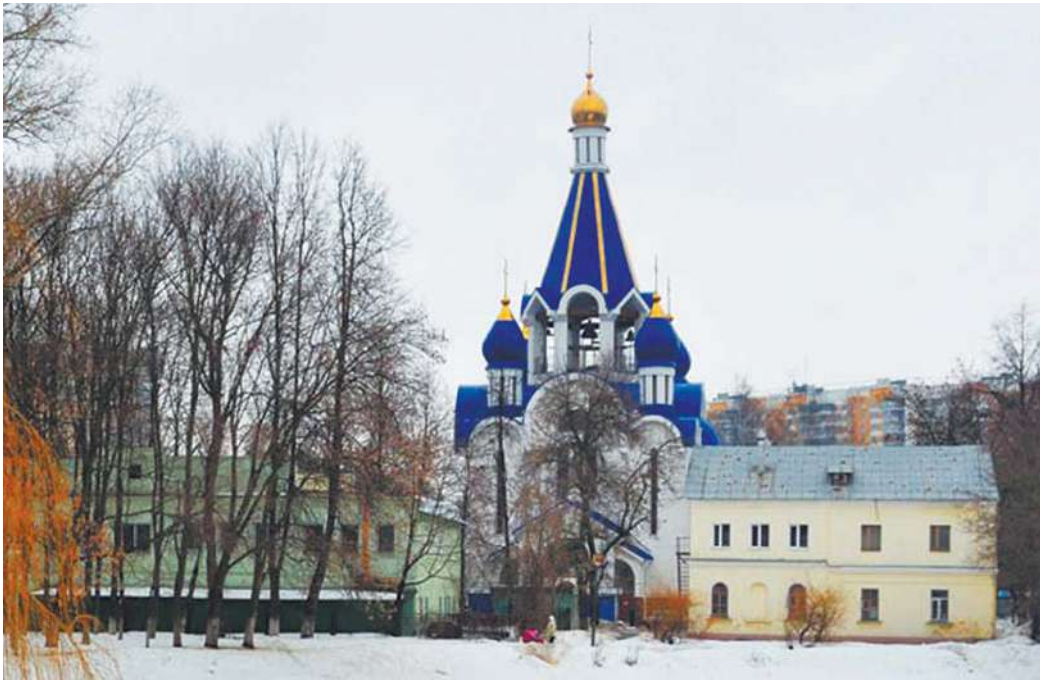
Храм в Костино восстанавливали всем миром