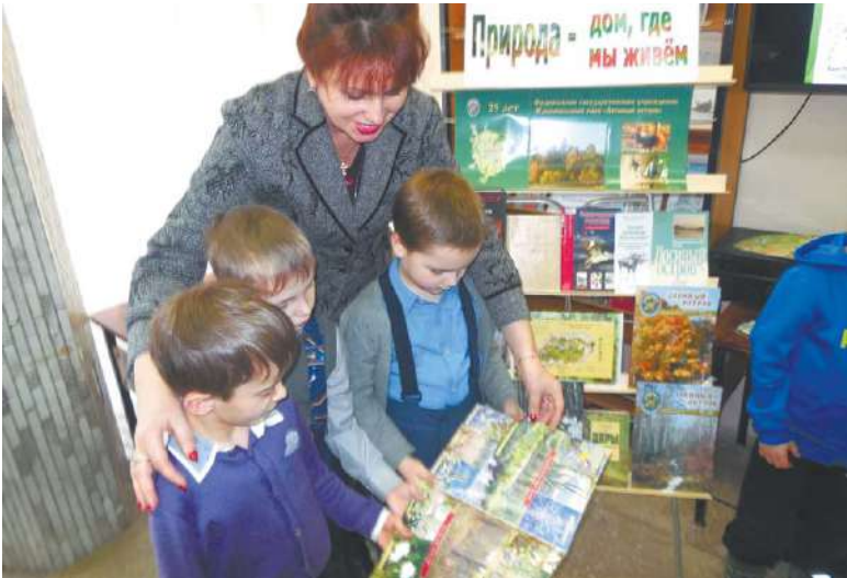
Участники мастер-класса в Центральной детской библиотеке

И кормушки бывают разными. Оказывается, кормушки «закрытого типа», то есть домик с