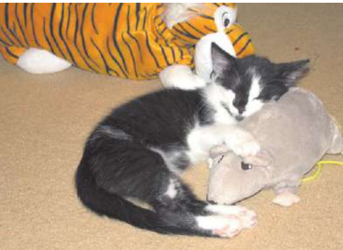
Алекс – самый известный котёнок нашего города

Книга «Котёнок в космосе», позднее вышедшая в издательстве «ЛАВР», а также продолжение приключений Алекса – «Котёнок и Сева с тополя» находят всё новых чита-