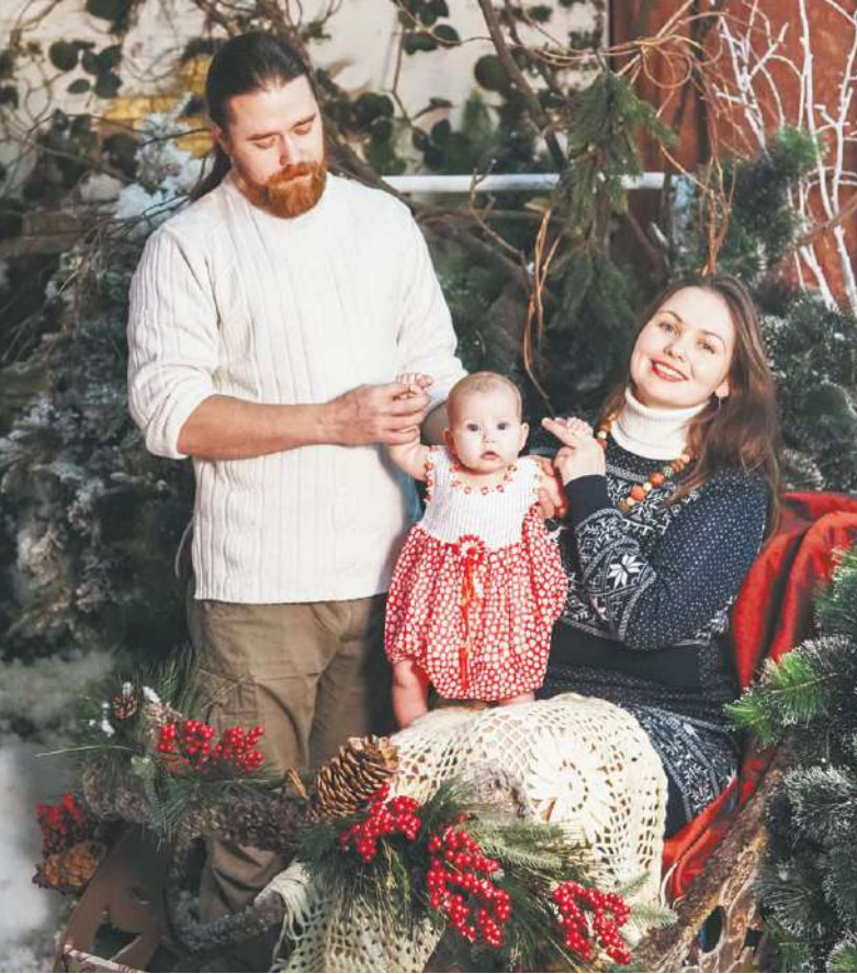
Источник вдохновения – в семье

Эта удивительно восторженная и светящаяся молодая женщина дарит радость в виде кружечек и