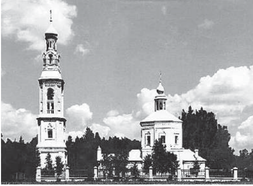
Богородицерождественский храм в XIX в.

Строительство храма Рождества Пресвятой Богородицы проходило при активном участии