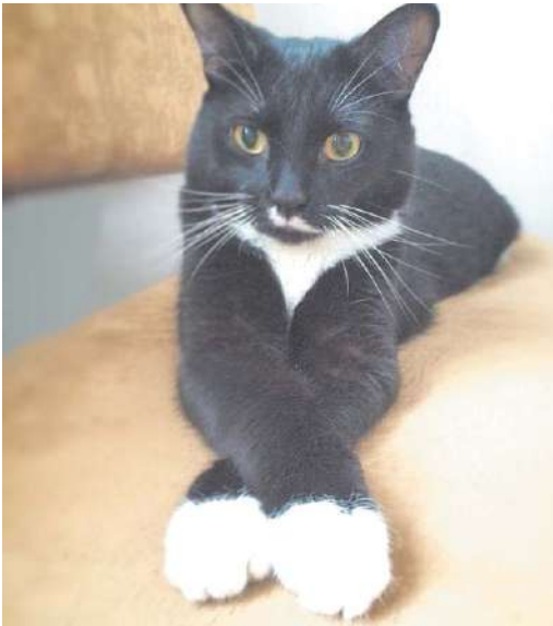
Марселя нашли на улице

Нина Екимовских: «Марселя мы нашли на улице... Шёл дождь. Выбежал под ноги мокрый и грязный комочек. Ну, как было не взять до-