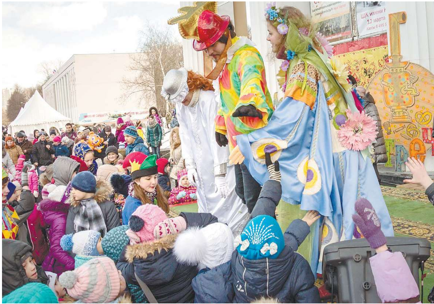
Празднование Масленицы на площади у ЦДК им. Калинина

ИМЕННО ТАК И ПРОИЗОШЛО, ВЕДЬ В ЭТОМ ГОДУ ПОСЛЕДНИЙ ДЕНЬ МАСЛЕНИЧНОЙ НЕДЕЛИ ПРИШЁЛСЯ НА 26 ФЕВРАЛЯ. МЕСЯЦ ВПОЛНЕ ЗИМНИЙ, ДА И ДЕНЁК ВЫДАЛСЯ ХОТЬ И СОЛНЕЧНЫМ, НО ВЕТРЕНЫМ.