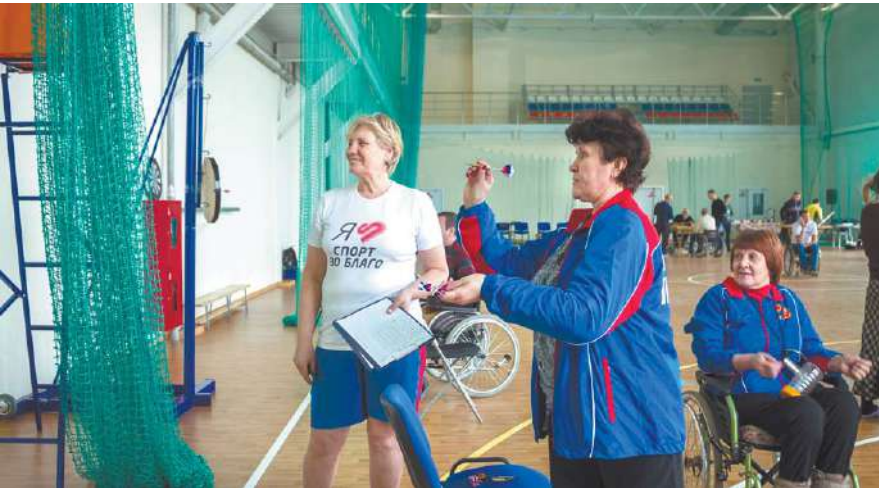
Посоревновались и в игре дартс

В последний день зимы в физкультурно-оздоровительном комплексе на стадионе «Металлист» прошёл первый фестиваль спорта среди инвалидов и людей с ограниченными возможностями здоровья под названием «Шаг вперёд».