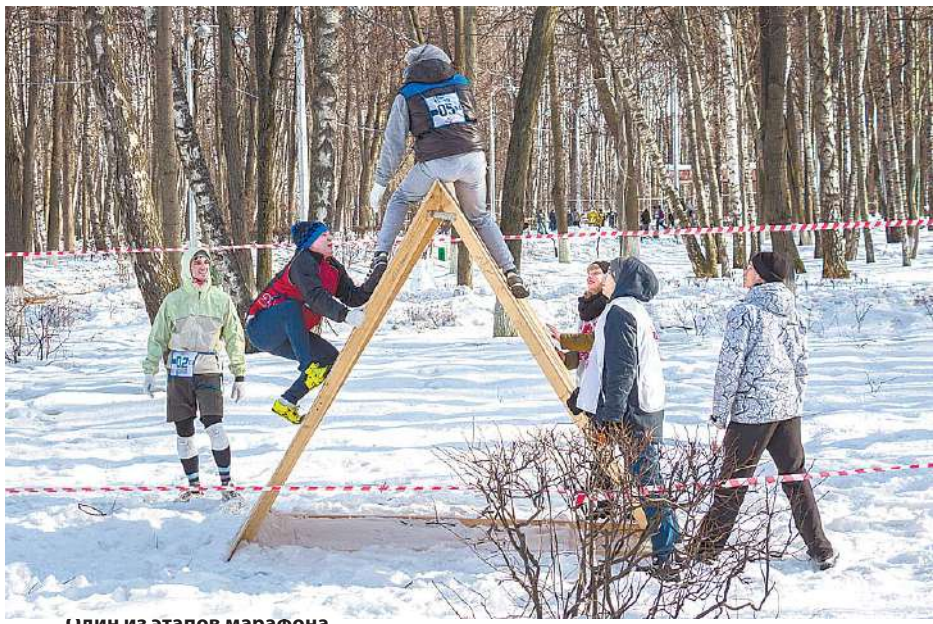
Удин из этапов марафона

Но мы не об этом! Команды выходили на старт по очереди. В зависимости от прохождения трассы предыдущими ко-