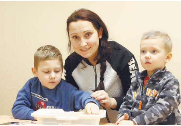
Мастер-класс по конструированию робота-крокодила