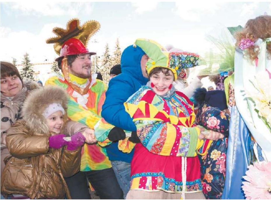
Гуляния на площади около ЦДК им. Калинина

мандами, стартовый интервал между ними варьировался. А теперь кратко об испытаниях. На трёхкилометровой извилистой трассе участников поджидали десять различных препятствий: это были подвешенные брёвна, по которым надо было пройти и не упасть; стены из дерева и сплетённых веревок; своеобразная переправа из дис-