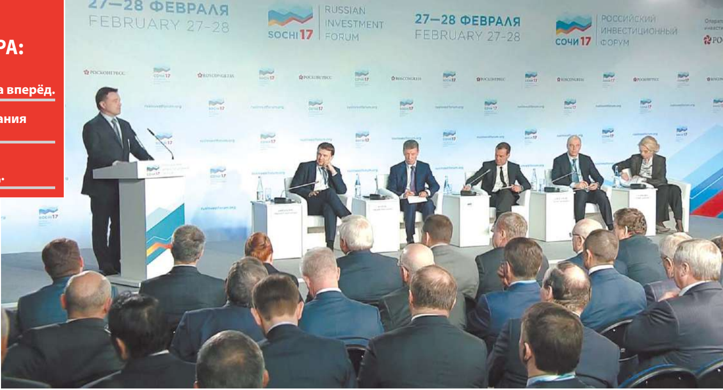
Губернатор Андрей Воробьёв во время выступления на сочинском форуме

Губернатор Подмоскoвьa обратил внимание на необходимость автоматизации процесса взыскания налоговой задолженности: – Считаю, что мы должны наладить автоматизированную систему взыскания задолженностей, а не перекладывать бумаги из ФНС мировым судьям и так далее – это всё огромная нагрузка. Нужна автоматизация, и я хотел бы попросить, так как это федеральный уровень администрирования, всё-таки обратить на это внимание. В завершение губернатор выступил с инициативой увеличения зачисления в бюджеты субъектов РФ госпошлины от работы МФЦ. – В МФЦ приходят миллионы людей, в 2013 году в Московской области их посетило полмиллиона человек, а в 2016 – уже 12 миллионов. Мы буквально загружаем