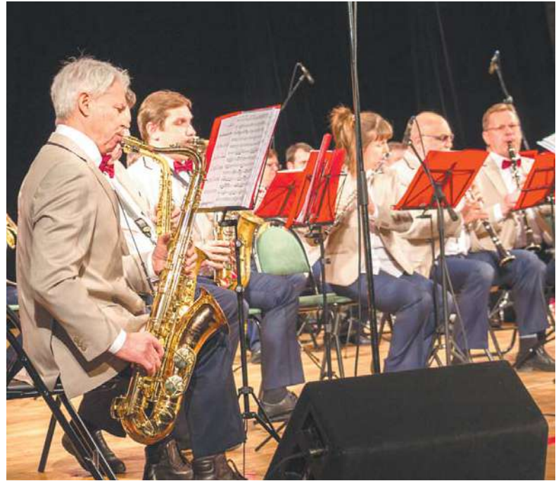
«Весёлые ребята» зажигают

Подготовила Лариса Верещетина